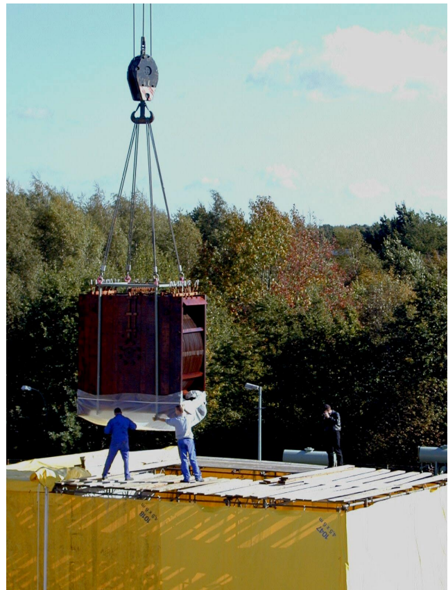
Abbildung 109: Einbau der neuen Wicklung für die Summendrossel.

In der Halle II wurden umfangreiche Magnetmessungen durchgeführt. Die Magnetbrücken wurden dort komplett aufgebaut und getestet, bevor sie in HERA eingebaut wurden.