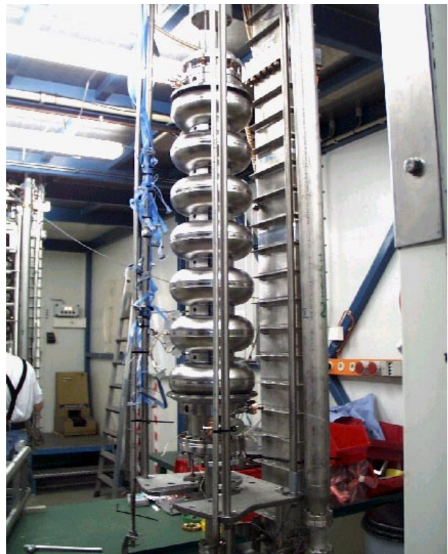
Abbildung 108: Superstruktur Typ 2 bei der Testmontage für den vertikalen Einsatz.

Für die Superstrukturen wurde eine supraleitende UHV-dichte Vakuumdichtung entwickelt. Hierzu wurde ein 2-zelliger Resonator mit entsprechender Flanschgeometrie ausgerüstet und die Dichtungstechnik an diesem Prototypen entwickelt. Die Grenzen dieser Dichtungstechnik sind bisher nicht bekannt, da das Testobjekt selbst mit 11 MV/m die Begrenzung des Gesamtsystems darstellt. Zur Verbesserung der Qualität und sicheren Handhabung der Resonatoren wurden neue Rahmenelemente entwickelt und in Betrieb genommen. Sie erlauben, sowohl die Superstrukturen als auch die Standardcavities mit 9 Zellen aufzunehmen. Durch leichtere Handhabung und präzise Halterung sind Veränderungen der Feldprofilverteilung sowie Verletzungen der Niob-Struktur ausgeschlossen.