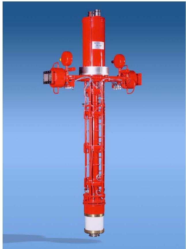
Abbildung 106: 10 MW Multibeam Klystron Thomson TH1801.

Einen Meilenstein für das TESLA-Projekt stellt der erfolgreiche Test des ersten Prototyps des 10 MW Multibeam Klystrons (Abb. 106) bei langer Pulsdauer dar. Bereits 1999 konnte der Prototyp beim Hersteller bei einer Ausgangsleistung von 10 MW und einer Pulsdauer von 500 \mu s erfolgreich getestet werden. Da dort aber keine Anlage zur Erzeugung von Hochspannungspulsen von mehr als 500 \mu s Pulsdauer zur Verfügung stand, musste dieser Test bei DESY erfolgen. In der zweimonatigen Betriebsunterbrechung von Mai bis Juni wurde einer der TTF Hochspannungsmodulatoren für den Betrieb mit dem Multibeam Klystron umgerüstet und das Klystron installiert. Das Klystron erreichte eine Ausgangsleistung von 10 MW bei einer Pulslänge von 1.5 ms. Die benötigte Hochspannung betrug 117 kV bei einem Strom von 131 A. Somit lag die Effizienz mit 65% relativ nahe bei dem angestrebten Wert von 70%. Zum Vergleich: Mit einem konventionellen 5 MW Singlebeam Klystron lässt sich nur eine Effizienz von 45% erreichen. Für den TESLA Linear-Collider werden 600 der Multibeam Klystrons benötigt. Seit Abschluss des erfolgreichen Tests wird das Multibeam Klystron als eines der Klystrons für den TTF-Betrieb eingesetzt.